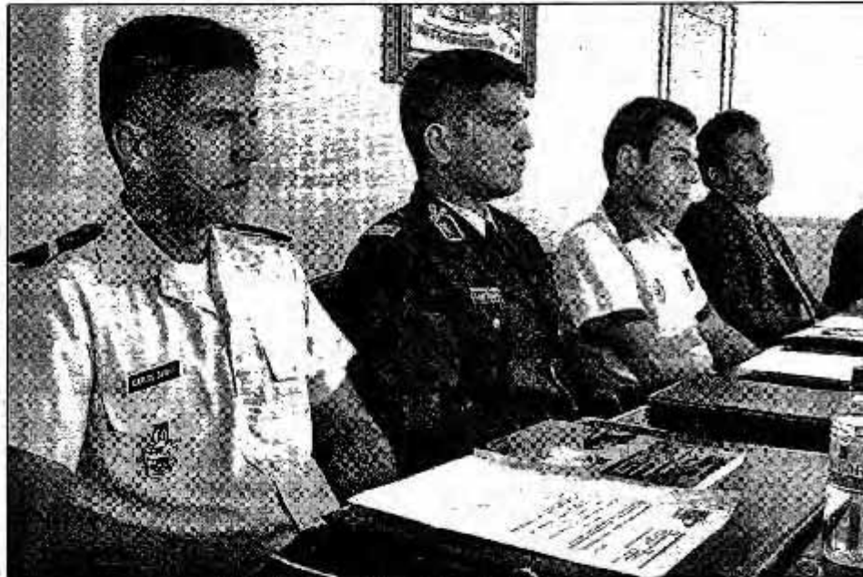
Representantes de las policías de Chaves y Verín, durante la primera reunión.

El proyecto también incluye el pase de una obra de teatro, que programará la Dirección General de Tráfico, que está destinada a los jóvenes de ambas localidades, principalmente con edades comprendidas entre los 16 y 18 años, en la que se abordará la problemática del alcohol en la conducción, la velocidad, el casco y el cinturón de seguridad, entre otros elementos que influyen en los índices de siniestralidad.